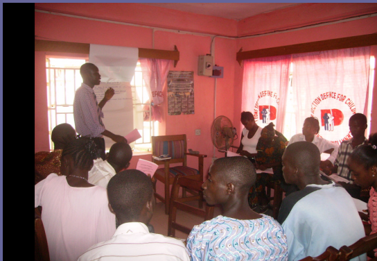
DEI Sierra Leone: Novembre 2006 Formation sur les droits des enfants pour les jeunes