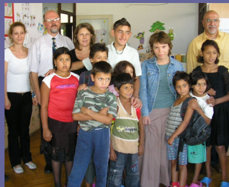
DNI Macedonia: Septiembre 2006 Programa educativo para los niños de la calle