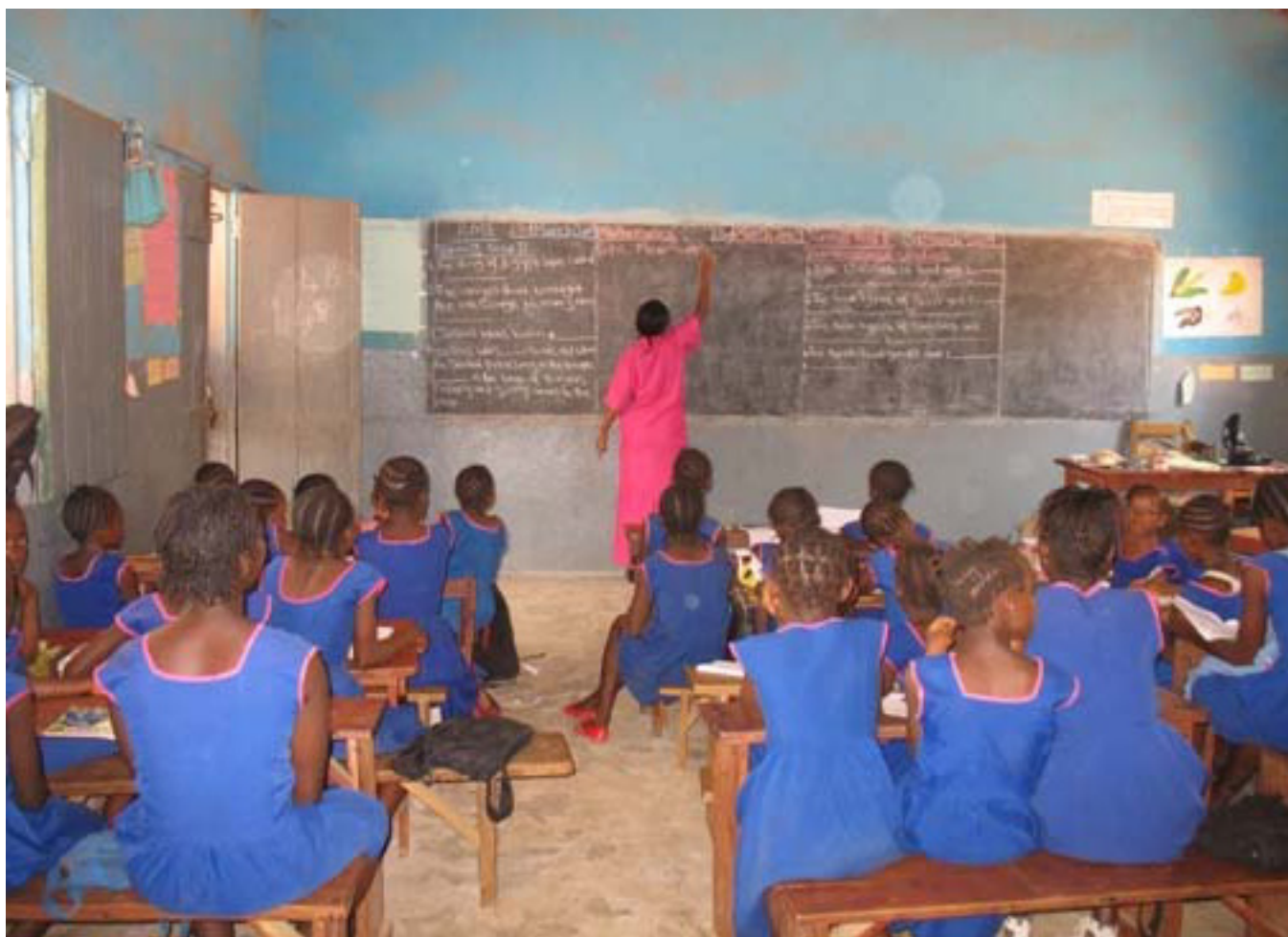
Chicas escuchando a la profesora en Sierra Leona.

Otros obstáculos institucionales supusieron el fracaso a la hora de llevar a cabo acuerdos que concluían en la falta de evaluaciones de los niños (Uganda); la retención de niños en cárceles de adultos en la ANP, donde se le rechaza casi de manera sistemática su derecho a la educación y formación (Palestina); el rechazo de material escrito, como periódicos y estudios políticos (Líbano); acceso limitado a bibliotecas (Ecuador) y la falta de personal (Nigeria).